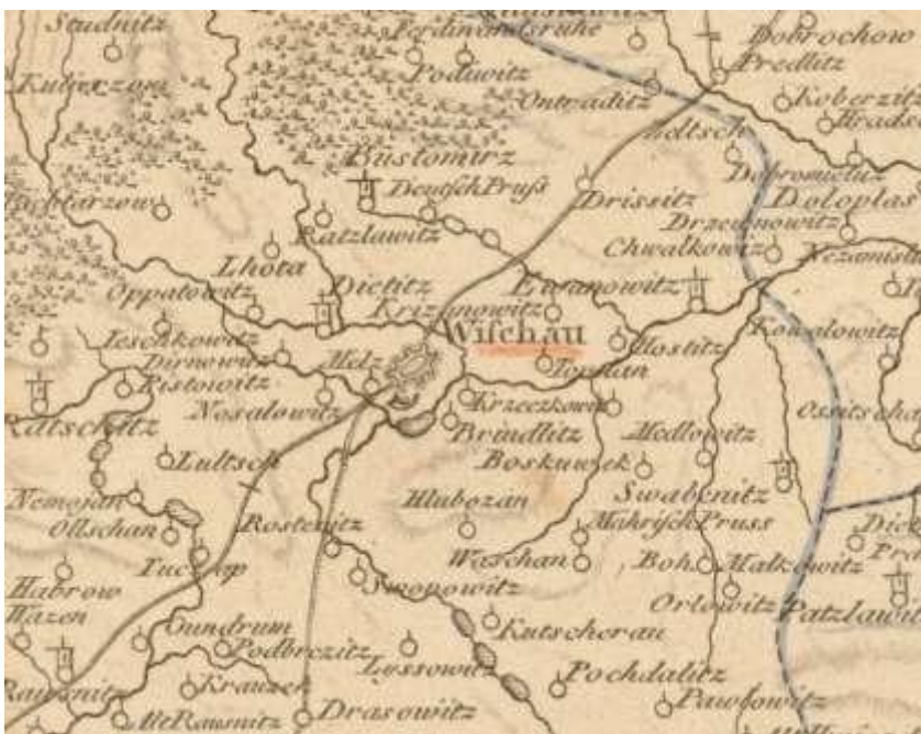
Výšeč zvětšené mapy Moravy s okolím Vyškova s Radslavicemi z roku 1742

Obecní pečeť pochází z roku 1826. Podle map Moravy z roku 1742 jsou Radslavice označovány jako Ratzlawitz